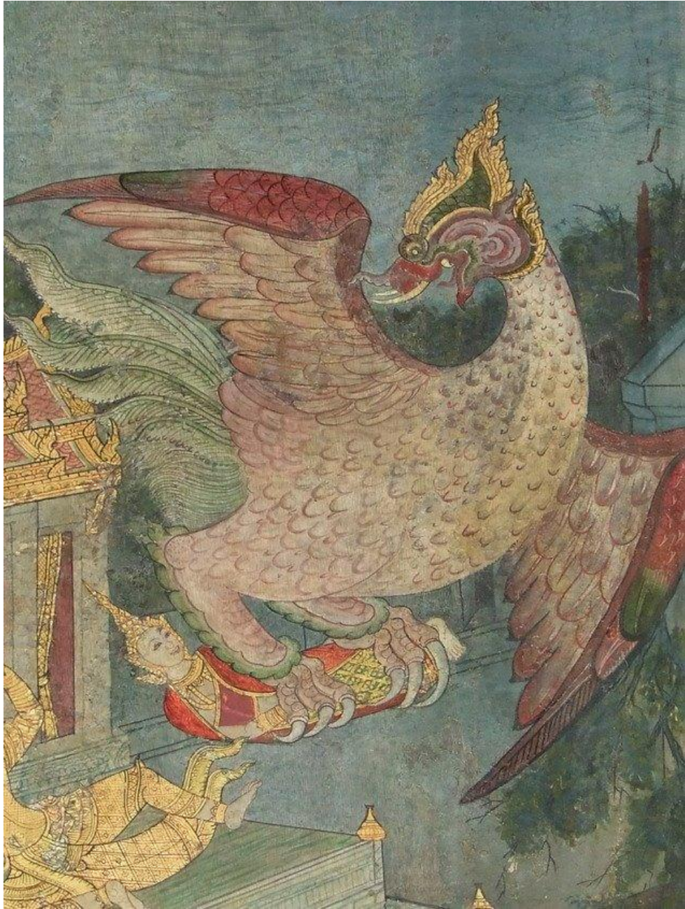
បក្សីហត្ថិលិង្គតាបយកព្រះអគ្គមហេសីព្រះបាទបូរន្ទប្បៈ

ព្រះរាជនិវេសន៍ ។ ព្រះរាជទេវីមិនអាចទៅដោយរហ័សបាន ព្រោះទ្រង់មាន គភ៌ចាស់ផង និងព្រោះជាស្រ្តីមានជាតិជាអ្នកខ្លាចផង ។ គ្រានោះ បក្សីនោះ ទើបតាបយកព្រះនាងនោះទុកក្នុងក្រញាំជើង ហើរទៅកាន់អាកាស ។