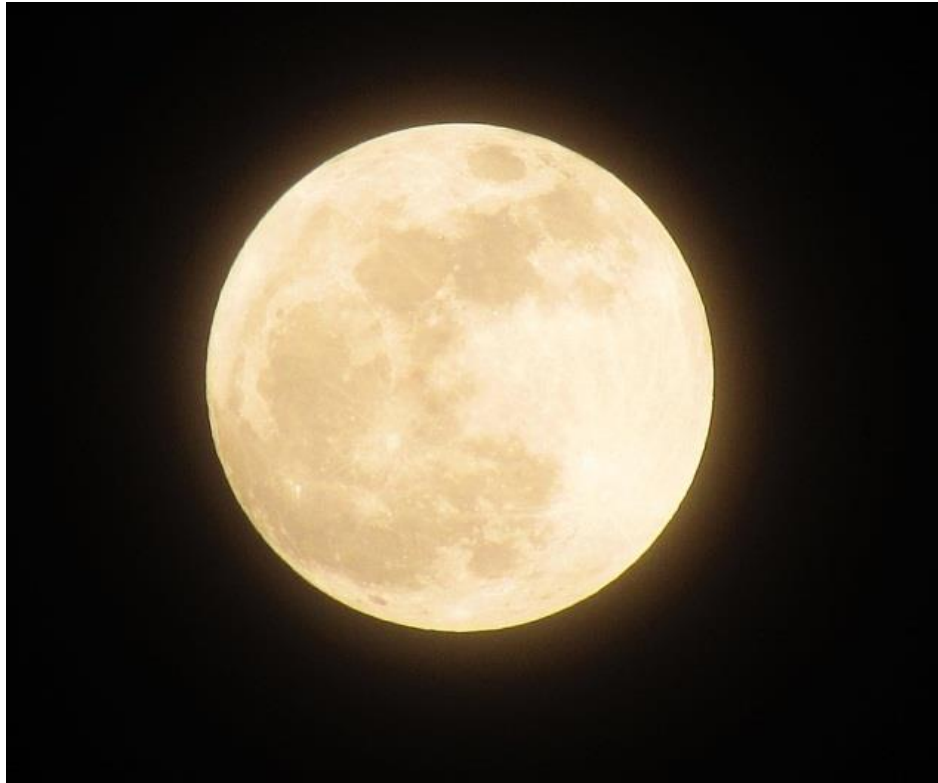
លក្ខណៈនៃសសបណ្ឌិតដែលជាប់នឹងមណ្ឌលព្រះចន្ទ

កាលជាទន្សាយឈ្មោះសសបណ្ឌិត ដល់ឥន្ទព្រាហ្មណ៍ពិតថាអត់អាហារ។